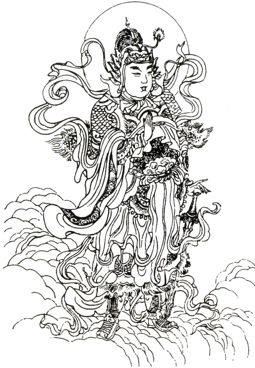
Nam Mô Hộ Pháp Chư Tôn Bồ Tát Ma Ha Tát.