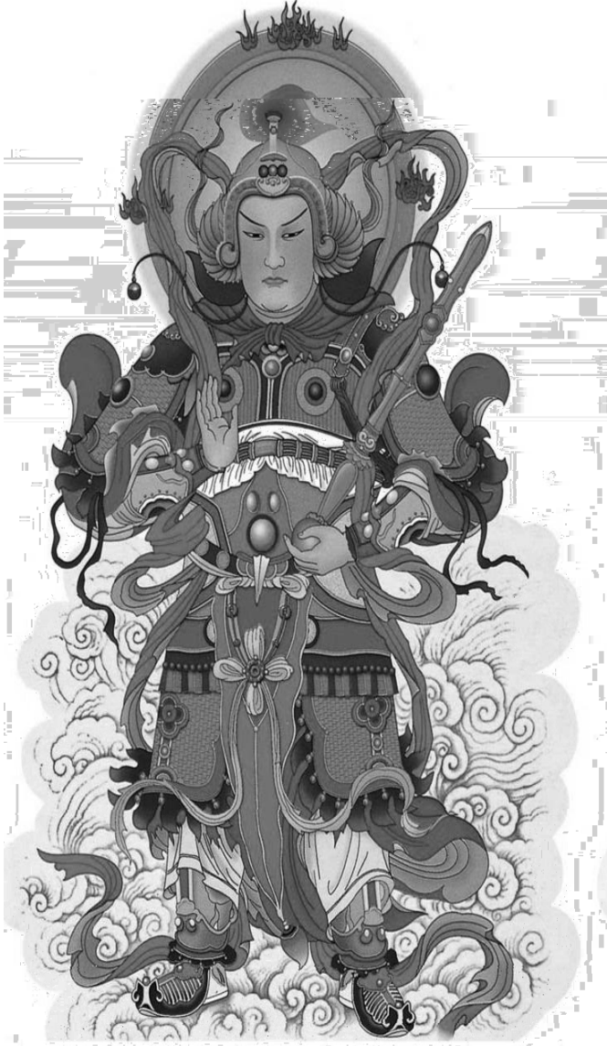
NAM MÔ HỘ PHÁP VI ĐÀ TÔN THIÊN BÒ TÁT